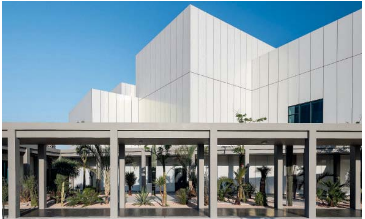
Dall'alto verso il basso e da sinistra verso destra: una vista del Jameel Art Centre, le installazioni Tree of Life e Seamless Blossom (selezionate dalla Urban